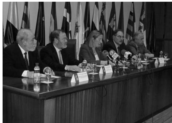
En el Centro, Ana Pastor, Ministra de Sanidad

En este instituto se llevarán a cabo proyectos de información, forma-