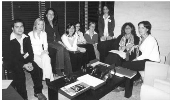
Imagen del Encuentro

El segundo día, tuvieron lugar los talleres de los profesionales de FEDER, en los que trataron temas como atención psicológica y social.